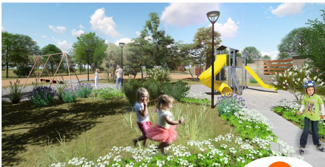
PROPUESTA ESPACIO VERDE